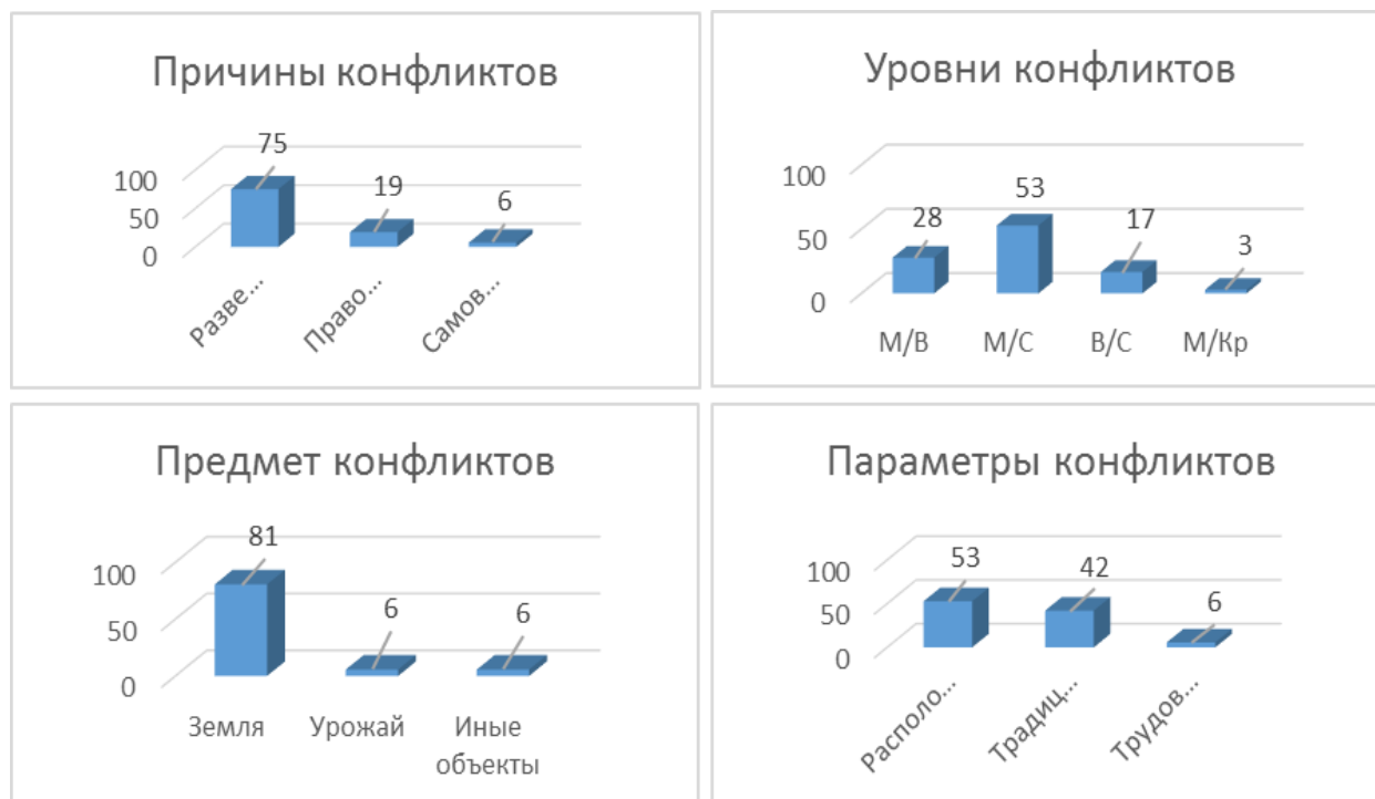
Рис. 3. Категории анализа конфликтов Данковского уезда 1918–1920 гг. (в %) Fig. 3. Categories of analysis of conflicts in Dankov county in 1918–1920 (in %)

лены следующие: земля, урожай и иные объекты (сад, сенокос, пруд, разработка камня). Категория «параметры конфликта» охватывает три элемента: расположение (дальний – близкий, черезполосный, в границах дачи селения и т. д.), традиции пользования (пользование ранее купленной или арендованной землей, или иным объектом, справедливость пользования), трудовые усилия (труд, вложенный в тот или иной объект). Анализируемые данные представлены в процентном отношении (рисунок 3).