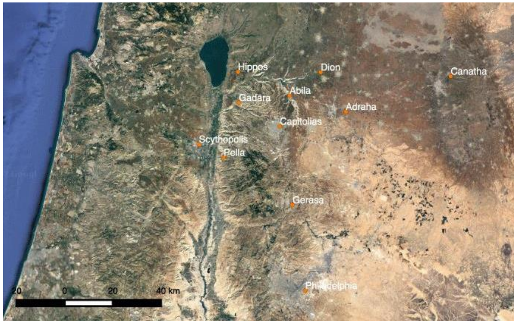
Рис. 1. Города Десятиградия [Cimadomo, 2017, p. 98]

разными и своеобразными. По этим причинам возникла необходимость проанализировать каждый отдельный город и изучить его развитие [Donceel, 1983].