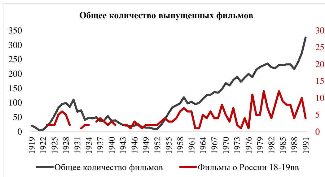
Рис. 1. Советские художественные фильмы. График выхода фильмов по годам

и запрещенных или утраченных. Так, установлено, что с 1919 по 1991 гг. снято и выпущено 7 850 художественных фильмов (рис. 1).