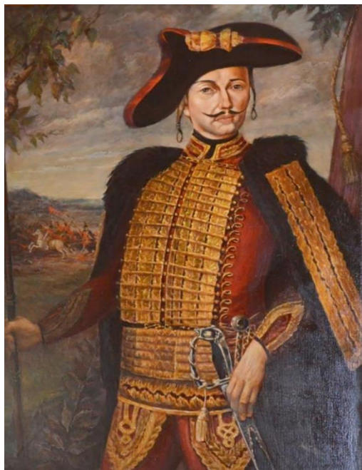
Рис. 3. Генерал Йован Самойлович Хорват Fig 3. General Jovan Samoilovich Horvath

Российский Сенат принял то же определение, и в последующие годы был издан ряд указов, определявших, что в Донской области могут селиться только поселенцы «из народов... сербской, македонской, болгарской и волосской (валашской) наций» и устанавливать и создавать колонии [ПСЗ, т. 13, с. 716]. В тех же декретах о колонизации и формировании воинских частей содержалась обязанность Хорвата сообщать о численности и составе полков.