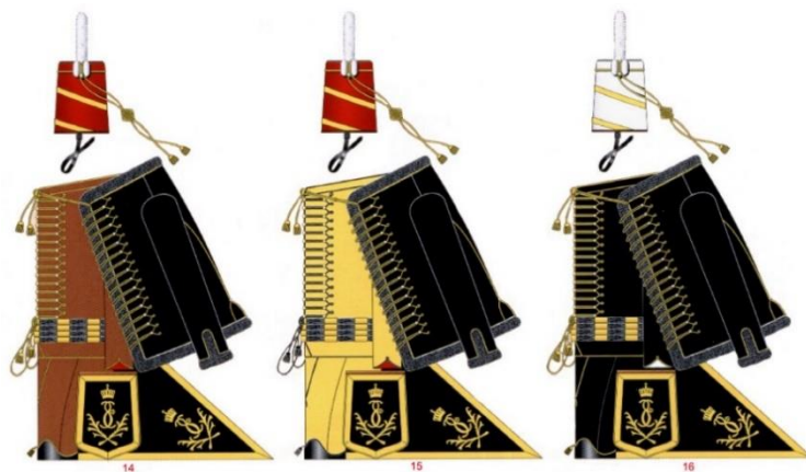
Рис. 5. Герб Македонского гусарского полка, утвержден в 1776 году Fig 5. The coat-of-arms of the Macedonian Hussar Regiment was approved in 1776

Русские документы свидетельствуют, что новый, Второй Македонский полк был создан 26.12.1776 г. и существовал до 28.06.1783 г., когда при новой реорганизации Македонский и Далматинский полки сливаются в новый Александрийский полк. Этот Второй Македонский полк имел также свой герб, который сохранился в книге «Гербы Полевых и поселенных Гусарских полков, с 1776 по 1783 гг.» 16 , но изображение не совсем такое, как в описании первого Македонского полка. Герб Македонского гусарского полка был утвержден в 1776 г.: «В красном поле серебряный щит, с различными орнаментами, а под ним две крестообразно лежащие деревянные стрелы с золотыми наконечниками» (рис. 5).