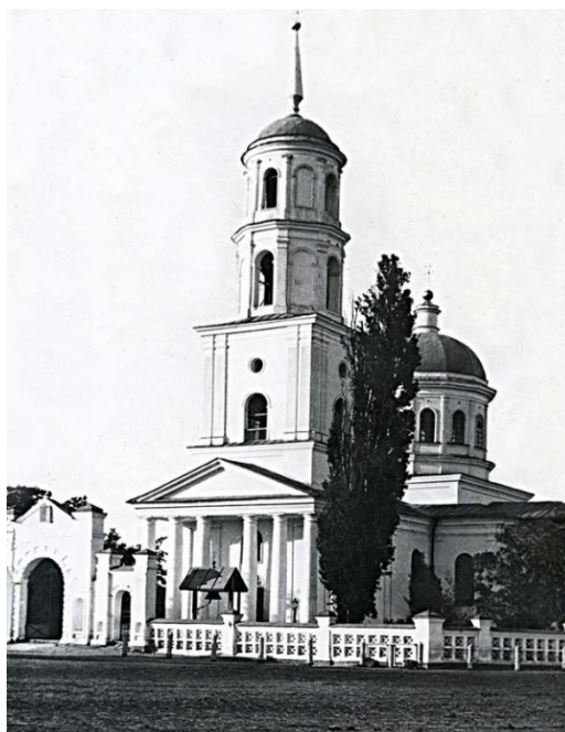
Рис. 4. Никольский собор в Новомиргороде. Возведено при поддержке генерала Хорвата Fig. 4. St. Nicholas Cathedral in Novomirgorod. Built with the support of General Horvath

Хорват прибыл в Киев в конце сентября 1751 г., а затем в октябре в Новомиргород (рис. 4). Для организации новых православных поселений Хорвата вызвали в Санкт-Петербург, где он представил свой проект перед императорским двором. После одобрения императрицы Елизаветы Петровны Сенат рассматривает его и в тот же день (24 декабря 1751 г.) утверждает проект. Через три недели, 11 января 1752 г., грамотой Военной коллегии Иван Хорват объявляется «генерал-майором» двух гусарских (кавалерийских) и двух пехотных полков, получивших наименование «Горватовский полк» или «Свободарский полк».