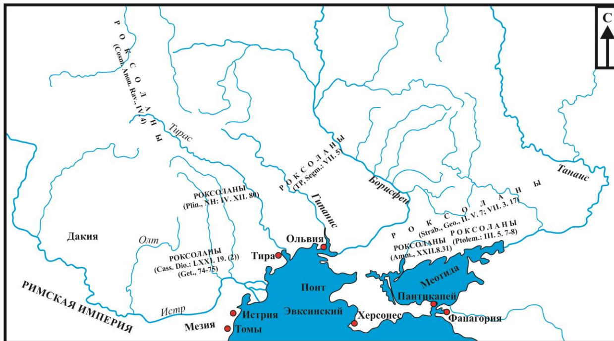
Рис. 1. Различная локализация роксолан в Восточной Европе согласно данным античной традиции Fig. 1. Different localization of roxolans in Eastern Europe according to the ancient tradition

Таким образом, мы можем говорить, что роксоланы появляются на карте Восточной Европы не ранее II в. до н. э. Основная территория, подконтрольная им – это степи Северного Причерноморья в междуречье Дона и Днестра. В I в. н. э. роксоланы пересекают Днепр, а ко второй половине I в. н. э. – уже вышли к восточному побережью Дуная. Начиная с конца II в. н. э. кочевья роксолан сосредотачиваются в степях Буджака и, вероятно, несколько севернее, в лесостепной зоне, в пограничье современной Молдавии и Украины. Мы видим постепенную миграцию роксолан от течения реки Дон до левобережья Дуная в пределах степной зоны (рис. 1).