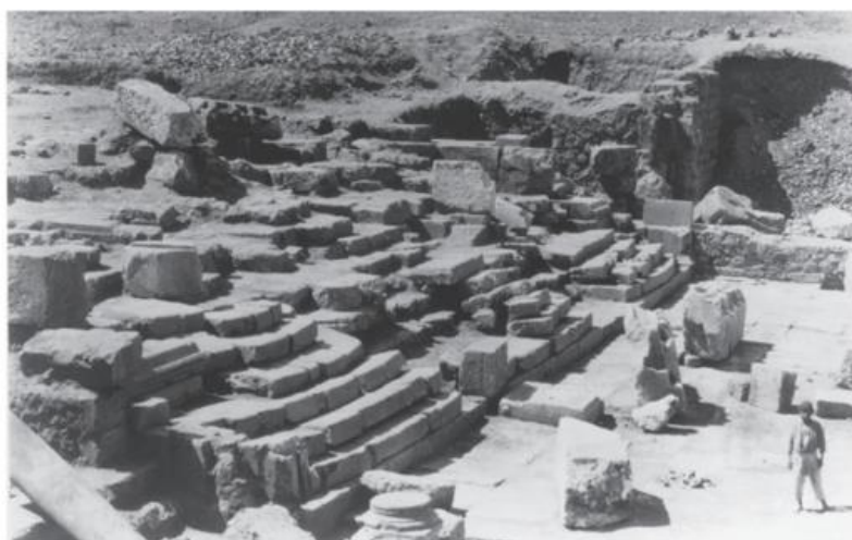
Рис. 3. Ступени Пропилона в 1924 г. Fig. 3. The steps and the propylon in 1924

К сожалению, Антиохия Писидийская практически не привлекала внимания отечественных исследователей (небольшое исключение – участие отечественных специалистов в естественно-научных обследованиях [Taşlıalan, Bagnall, Smekalova, Smekalov, 2003]), как и до недавнего времени Писидия в целом. Изучение римско-византийской Малой Азии должно занять важное место в отечественной исторической регионалистике.