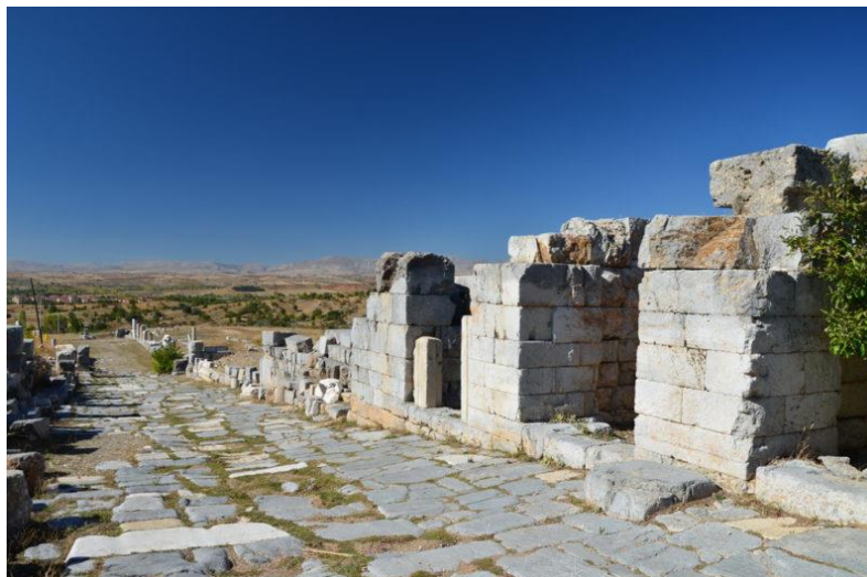
Рис. 6. Улица Кардо Fig. 6. Cardo street