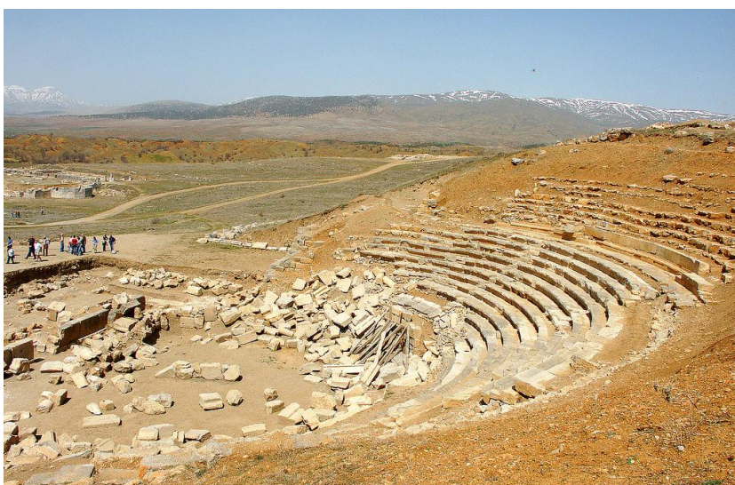
Рис. 5. Театр Fig. 5. Theater

Статьи о различных аспектах истории этого места периодически появлялись в течение XX в., но до сих пор не проводилось всестороннего исследования топографии города и сохранившихся зданий. Антиохия Писидийская практически не представлена в отечественной историографии.