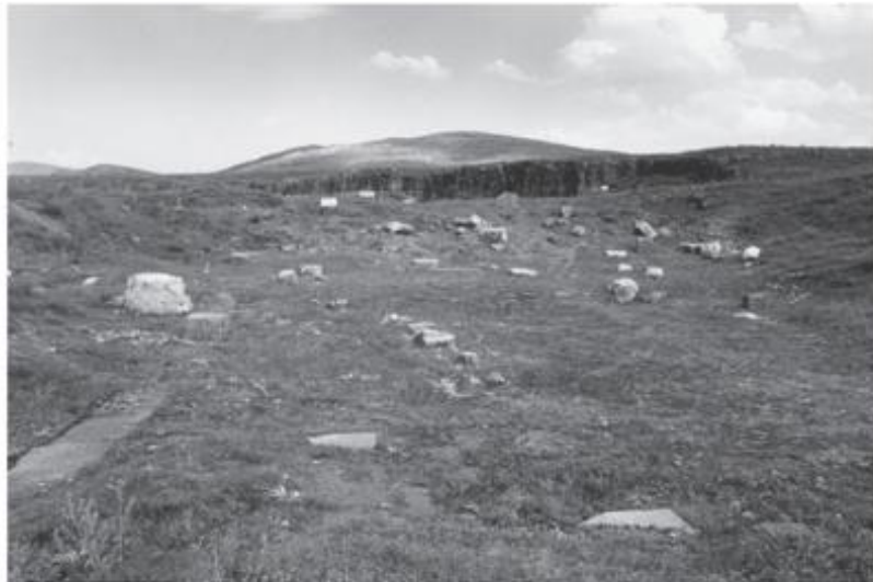
Рис. 4. Площадь Тиберия и область Пропилона (1982) Fig. 4. The Tiberius platea and the area of the propylon (1982)