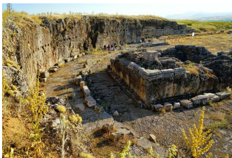
Рис. 8. Храм Августа Fig. 8. Temple of Augustus