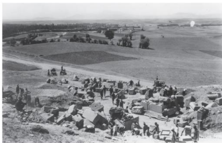
Рис. 2. Раскопки городских ворот Мичиганской экспедицией Fig. 2. The excavation of the city gate by the Michigan expedition

В последние годы XIX в. и первые три десятилетия XX в. Писидийская Антиохия и в меньшей степени ее сестринские колонии, как отмечает Б. Левик, были предметом многочисленных отдельных статей.