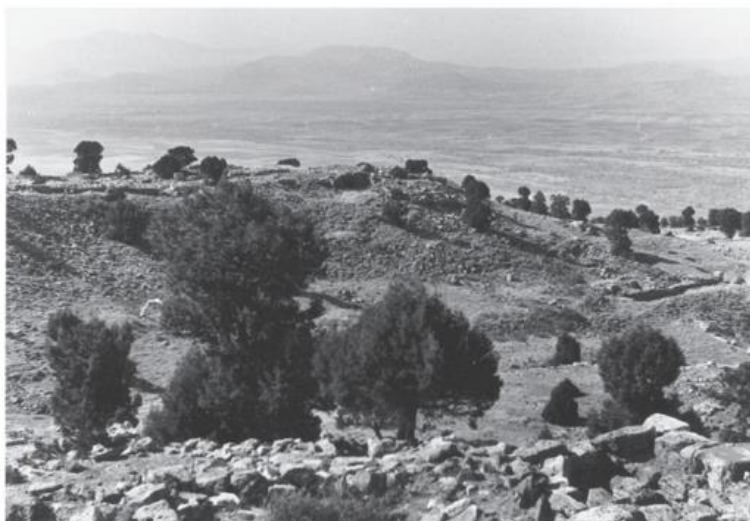
Рис. 1. Общий вид святилища Мена Аскаэна с вершины небольшого храма Fig. 1. General view of the Men Askaenos sanctuary from the peak above the small temple

Рамсей снова вернулся на это место в 1925–1927 гг., но без особых результатов. Роль этого ученого в изучении города заслуживает отдельного, более глубокого изучения. В последние годы издаются его материалы [Burne, Ramsay, Labarre, 2006]. Особенно важны фотографии, которые сделал Рамсей во время своих экспедиций (рис. 1, рис. 2).